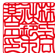
B24 24mm 角 角印