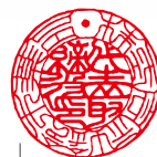
B18 18mm 丸 代表者印